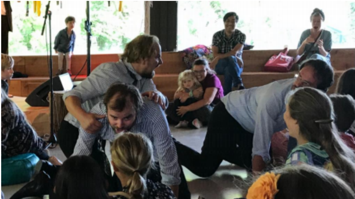
Woekerpolis tijdens Kindermuziekfestival in Tolhuistuin Amsterdam

Door het loslaten van de gedachte altijd met 4 Wildemannen te willen spelen, werden we veel flexibeler. Het maakte het makkelijker qua planning en leverde prachtige samenwerkingen op met artiesten en kunstenaars uit andere disciplines.