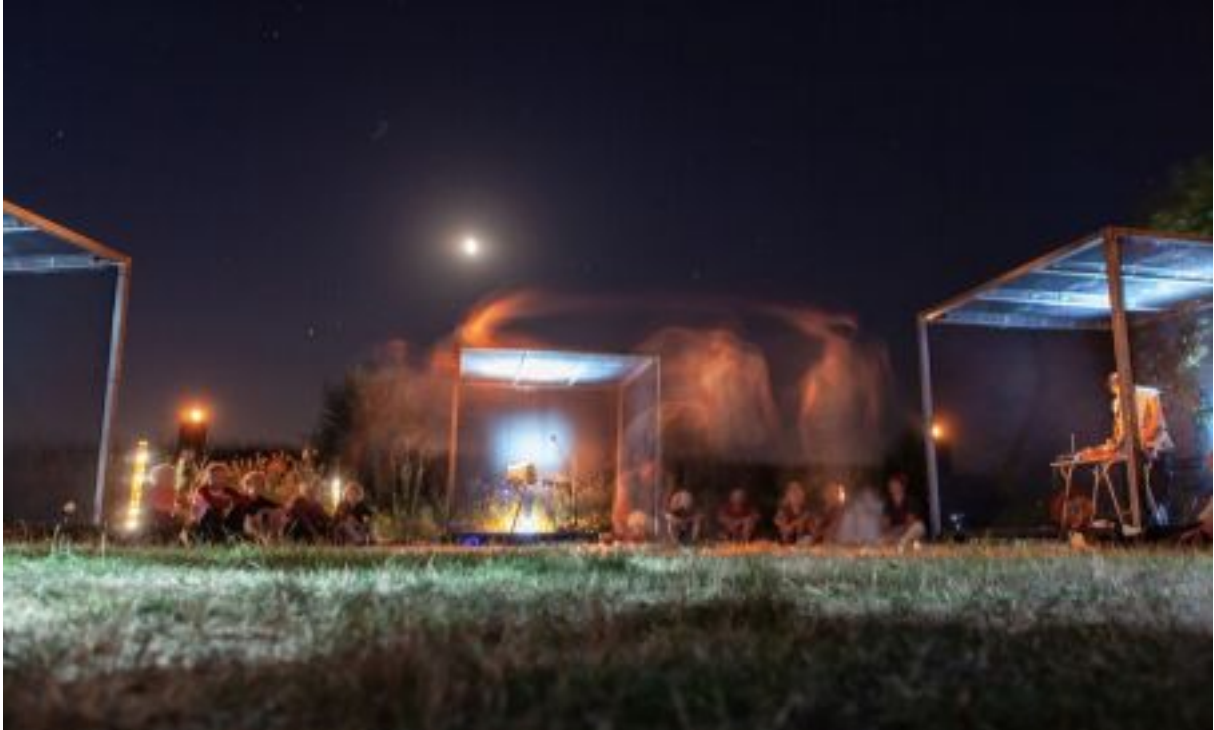
Nachtvluucht op Festival Heimland in Diepenheim

Het bestuur kwam in 2019 viermaal bijeen, op 26 februari, 25 juni, 8 oktober en 17 december.