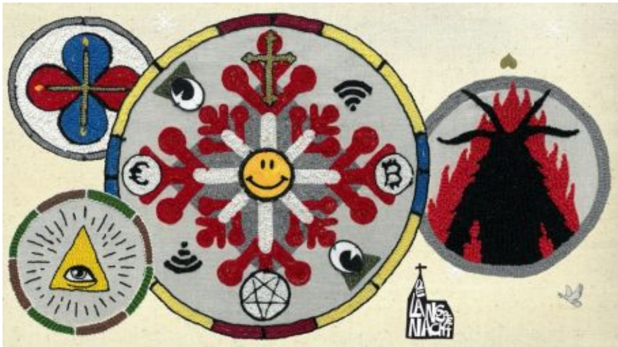
Project Wildeman en Cappella Amsterdam, De Langste Nacht, ontwerp Mick Johan