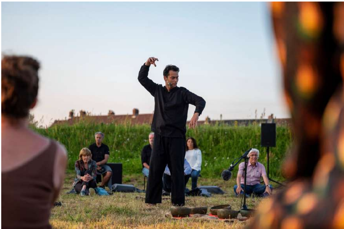
Manual for the Displaced tijdens Festival Boulevard © Karin Jonkers