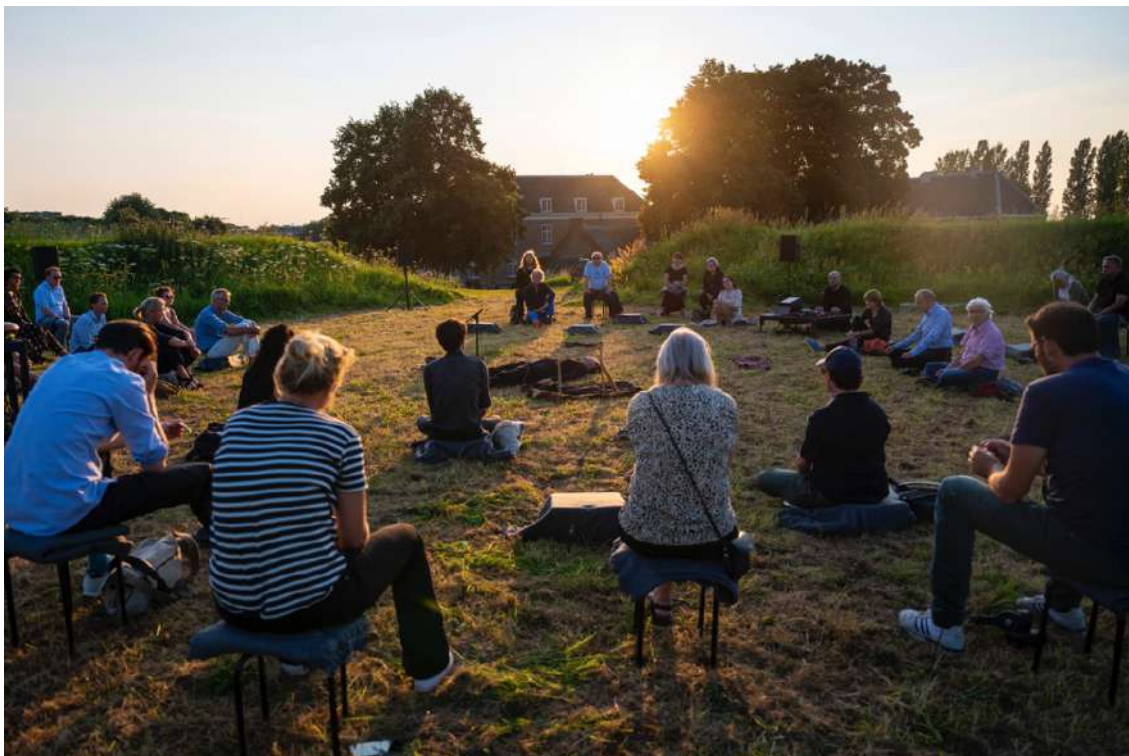
Manual for the Displaced op Festival Boulevard

vatten. Oerol en Festival Karavaan werden net zo enthousiast als wij en we dienden aanvragen in bij het Stimuleringsfonds voor Creatieve Industrie, het Prins Bernhard Cultuurfonds en Zabawas. De eerste twee aanvragen werden gehonoreerd en er was een go. In januari 2022 legden we ook de speelplekken in Amsterdam vast – in het Amstelpark bij Zone2Source, podium voor kunst, natuur en technologie in het Amstelpark – en dienden we een subsidieaanvraag in bij het Amsterdams Fonds voor de Kunst. De laatste weken van 2021 begonnen de eerste onderzoeksweken; op locatiebezoek naar Terschelling voor Oerol en bij Alkmaar voor Karavaan; het maken en bedenken van ontwerpen van de objecten van Rosalie en het onderzoeken en verzamelen van muzikaal materiaal. Ook in deze dagen heeft corona her en der roet in het eten gegooid: Oerol beperkte de groepsgrootte en zo kon niet iedereen mee naar Terschelling, en door corona in het team vielen een aantal performers uit. Desondanks hebben we hele mooie vorderingen kunnen maken, zoals het onderzoeken van een allesomvattende Dolby Atmos geluidsinstallatie waarmee we het publiek hopen te kunnen omsluiten, bij wijze van een technologische natuurtempel. We kijken uit naar de volgende onderzoeksweken en natuurlijk naar het spelen volgende zomer!