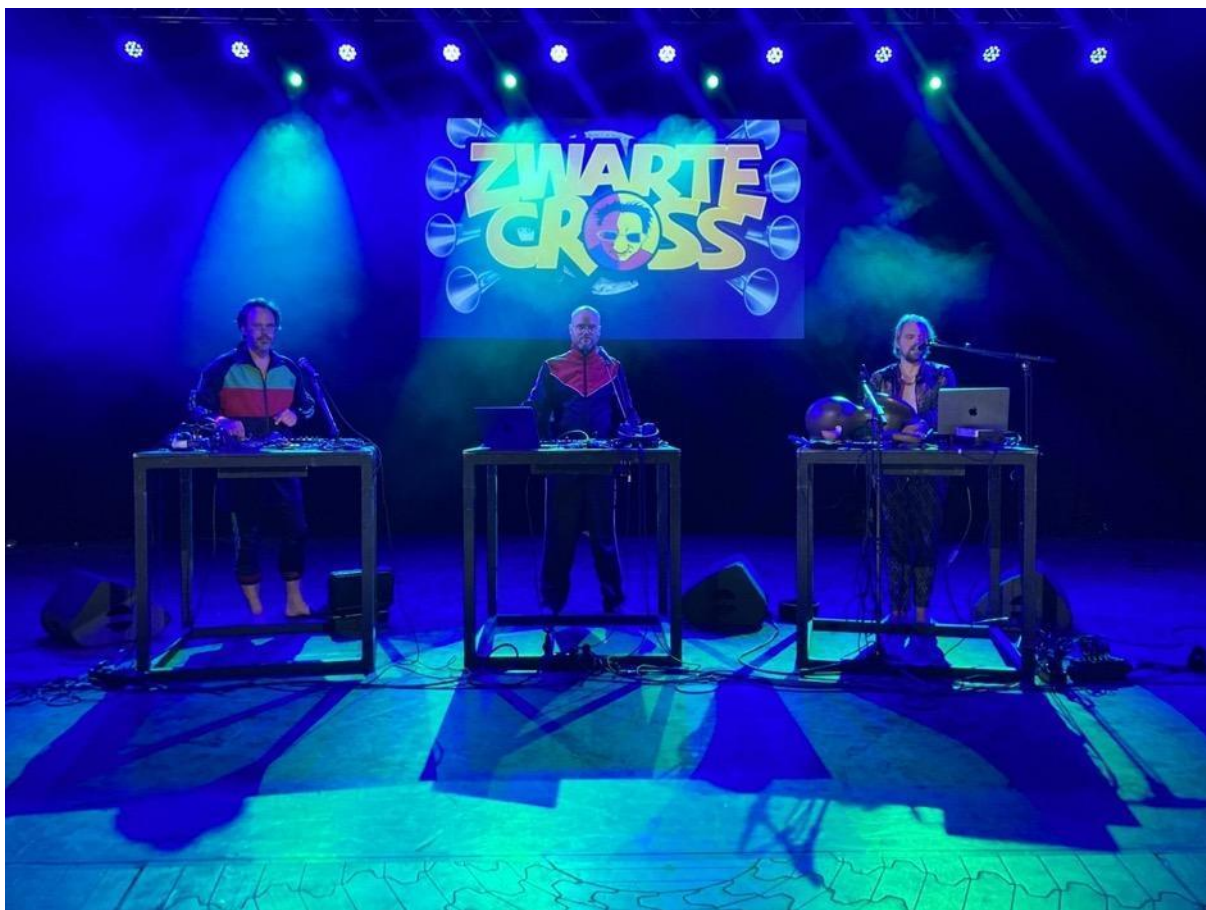
Project Wildeman op de Zwarte Cross