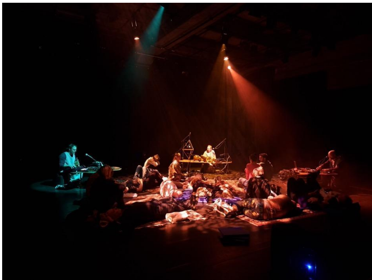
Project Wildeman bij Intro in Situ

We zijn ons ervan bewust dat we nog vele stappen moeten zetten om daadwerkelijk diverser en inclusiever te worden als organisatie en in ons publieksbereik.