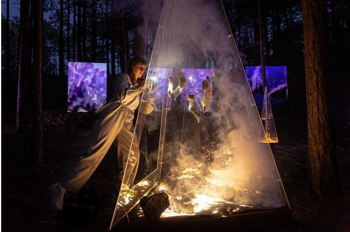
The Sacred Life of Plants op Oerol

werkte het stukken beter. Het kwam nog meer tot z'n recht toen we de laatste avond noodgedwongen door helse onweersbuien alles naar binnen in een grote koelcel/schuur hadden verplaatst, zodat alle kunstwerken van Wammes veel dichters bij elkaar en het publiek opgesteld stonden. Er ontstond zodoende een veel intiemer schouw- en samenspel, wat de artistieke inhoud echt ten goede kwam.