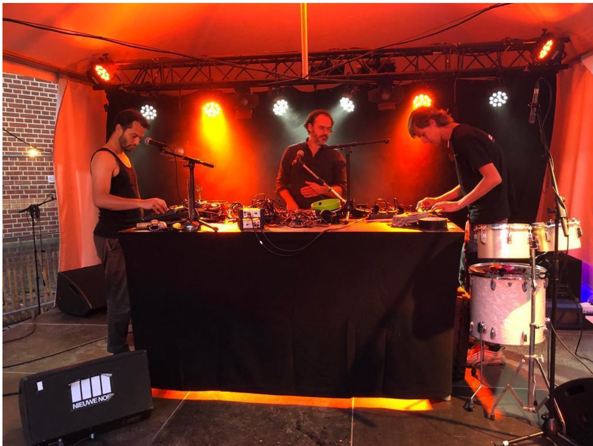
Dogman op de Popronde